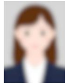
写真がボケている (不鮮明)