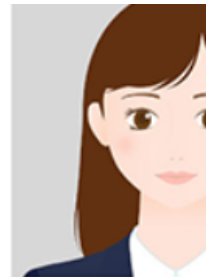
顔全体が見えない (顔周りの余白がない)