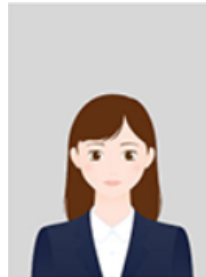
余白が大きすぎる